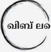
ഖിബ് ലയെ അഭിമുഖീകരിച്ച് ഇഹ്റാമിൽ പ്രവേശിക്കുക.