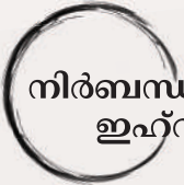
നിർബന്ധ നമസ്കാരത്തിന് ശേഷം ഇഹ്റാമിൽ പ്രവേശിക്കുക.