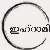
ഇഹ്റാമിന് മുമ്പ് കുളിക്കുക