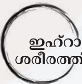
ഇഹ്റാമിന്റെ വസ്ത്രത്തിലാവാതെ ശരീരത്തിൽ മാത്രം സുഗന്ധം പൂശുക.