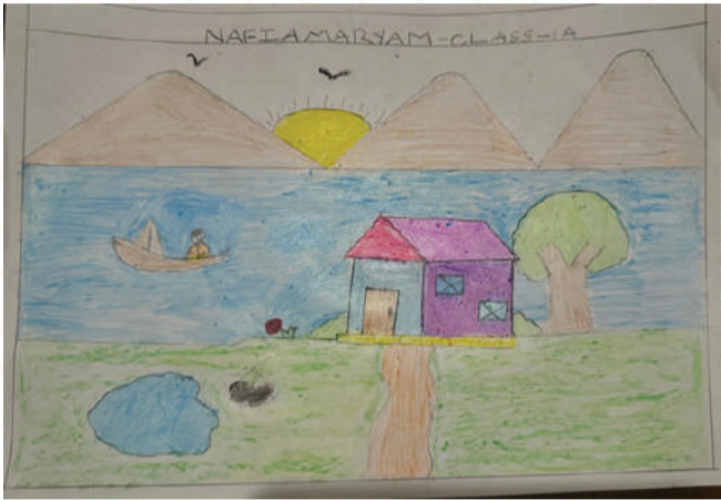
NAFIYA MARIYAM, CLASS: 1