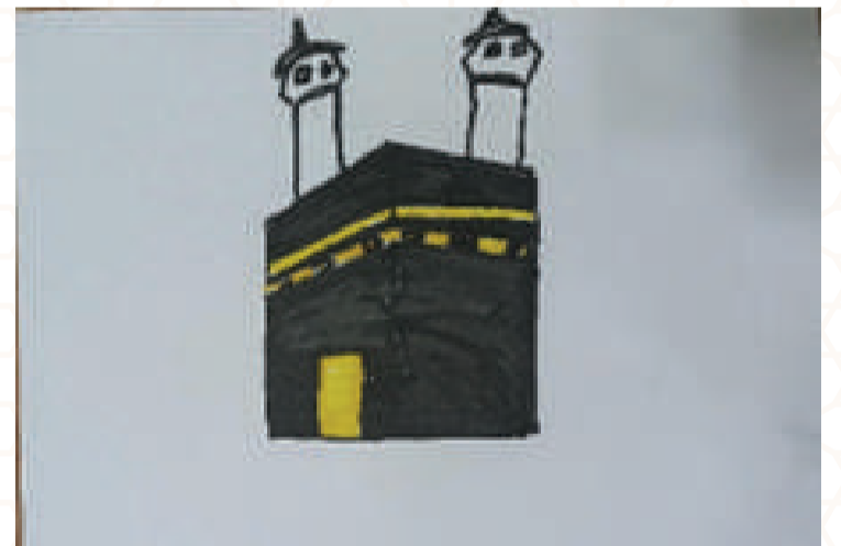
ADNAN BIN ANAS : CLASS 5