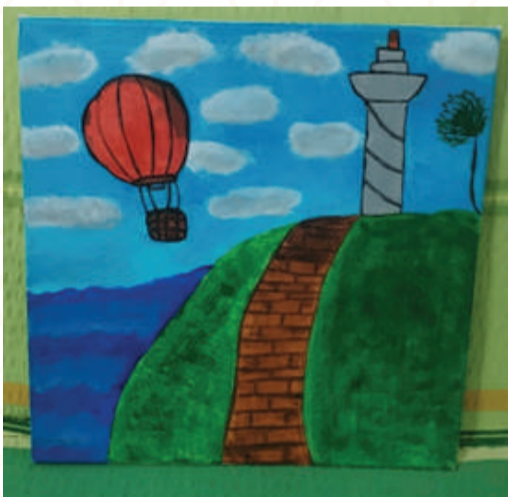
ADNAN BIN ANAS : CLASS 5