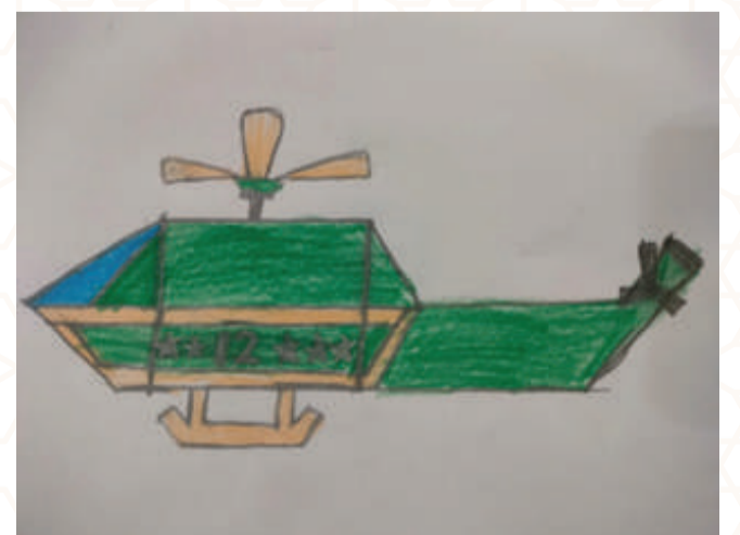
HATIM ABDUL VAHAB, CLASS 1