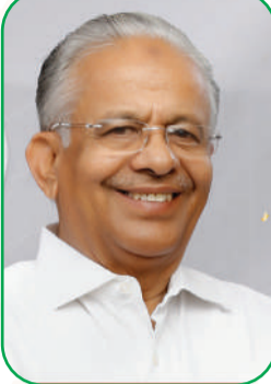
ഇ. ടി. മുഹമ്മദ് നാജീർ മെമ്പർ ഓഫ് പാർലമെന്റ്