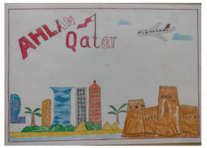
IHAN ABDUL VAHAB, CLASS : 4