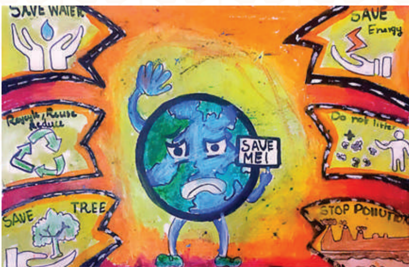
REHAN PALAKKAL, CLASS : 4