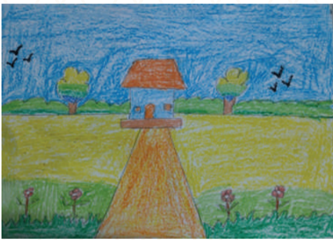
AYISHA ABDUL GAFOOR, CLASS : 3