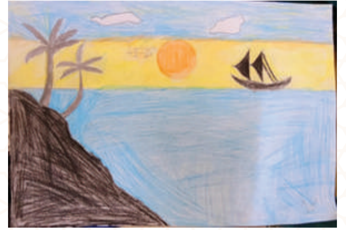
NOUF BIN NOUSHAD, CLASS 3