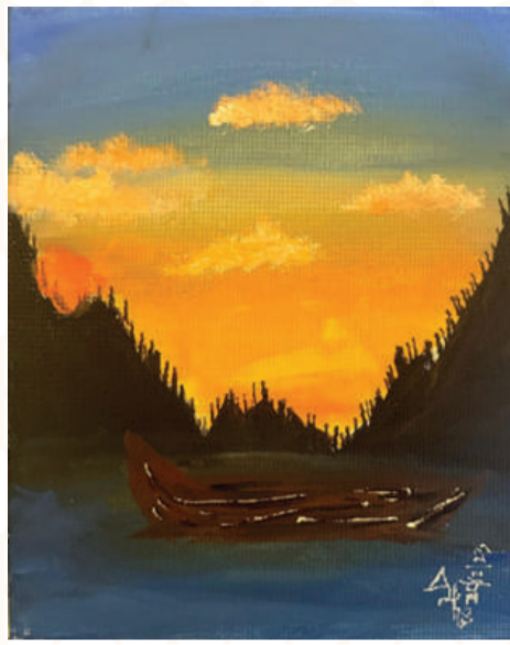
IHSAN MOHAMMED PV, CLASS : 6