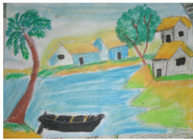
SHAZNEEN TV, CLASS : 4