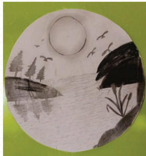
NOURIN BIN NOUSHAD, CLASS : 5