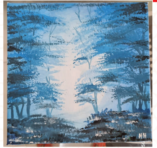
HIRA HASHIR, CLASS : 2